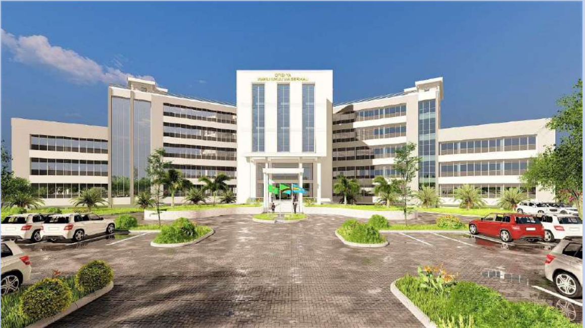
Muonekano wa Mbele (front view) wa Jengo jipya la Ofisi ya Wakili Mkuu wa Serikali linalotarajiwa kujengwa katika Mji wa Serikali Mtumba Jijini Dodoma