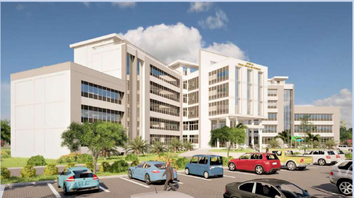
Muonekano kwa upande (side view) wa Jengo jipya la Ofisi ya Wakili Mkuu wa Serikali linalotarajiwa kujengwa katika Mji wa Serikali Mtumba Jijini Dodoma