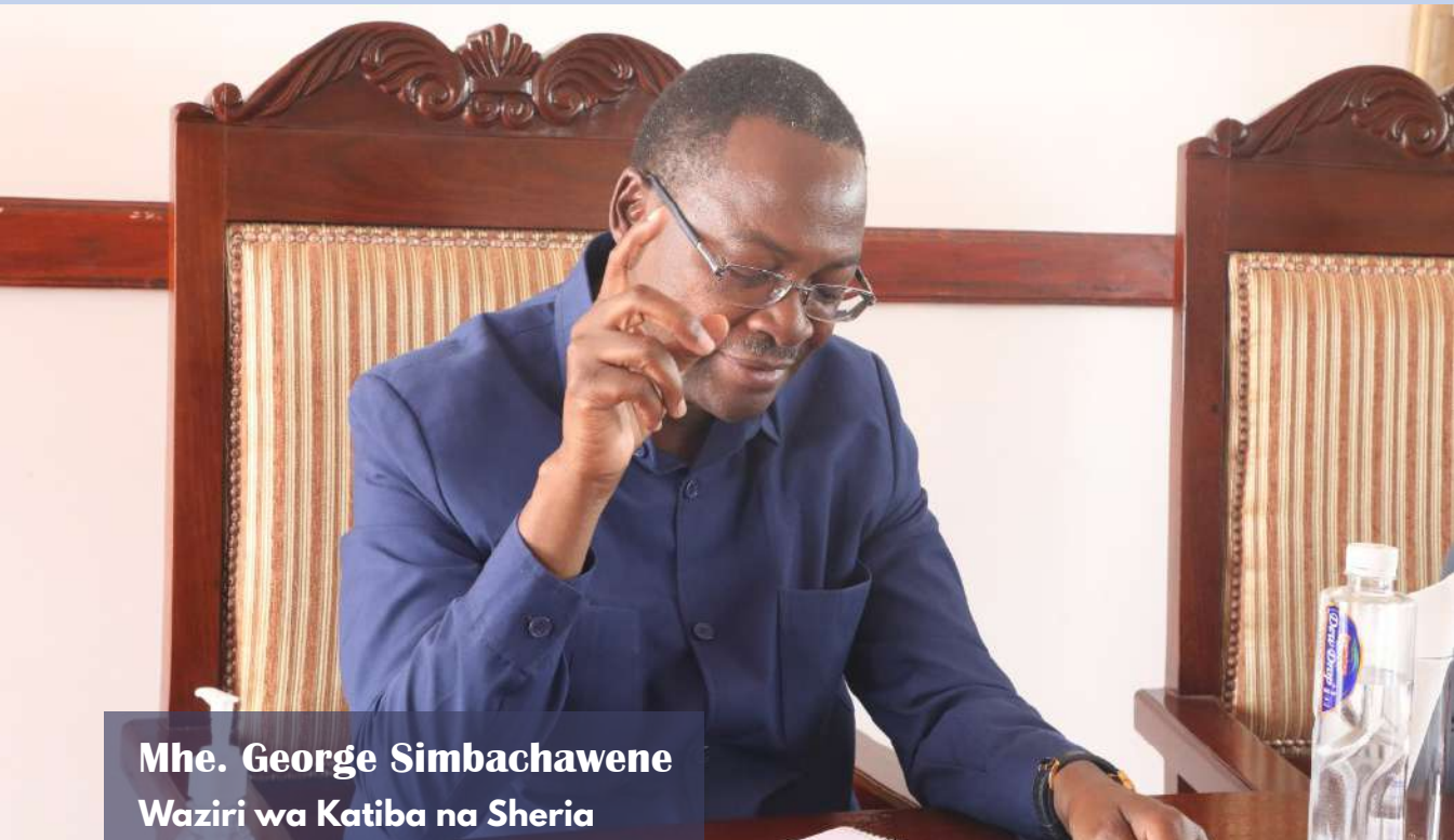
Mhe. George Simbachawene Waziri wa Katiba na Sheria