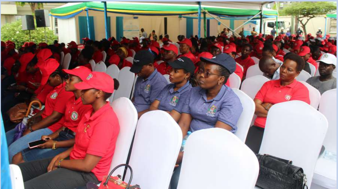
Baadhi ya Watumishi wa Ofisi ya Wakili Mkuu wa Serikali waliohudhuria kilele cha Maadhimisho ya Wiki ya Sheria Kanda ya Dar es Salaam