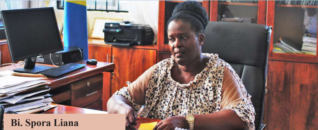
Bi. Spora Liana Mkurugenzi wa Jiji la Tanga

O fisi ya Wakili Mkuu wa Serikali mkoani Tanga imepongezwa kwa usimamizi mzuri wa Mashauri ya Serikali na Taasisi zake kwa kuweza kusaidia kuwajengea uwezo Mwakili wa Taasisi nyingine katika kuandaa na kusimamia Mashauri dhidi ya Taasisi zao.