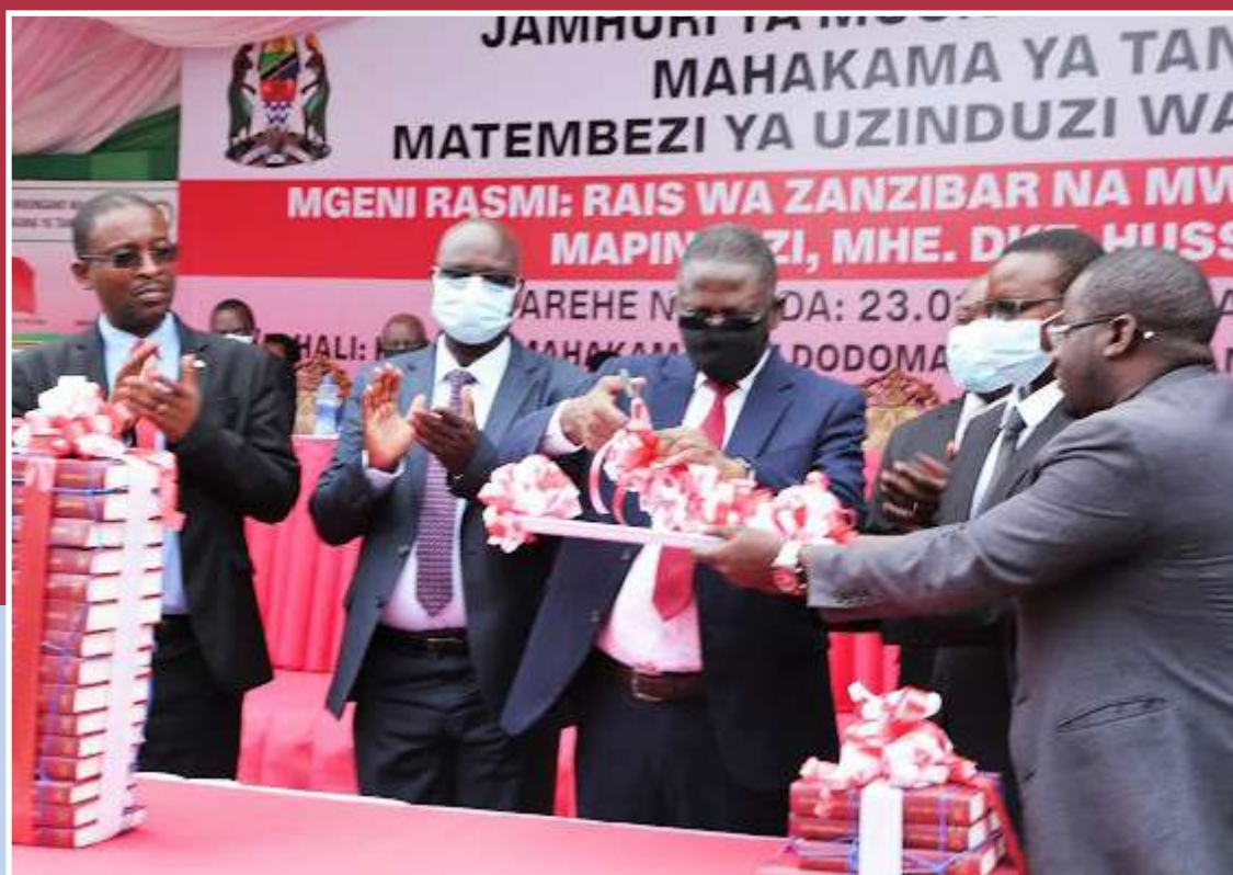
Jaji Mkuu wa Tanzania Mhe. Profesa Ibrahim Hamisi (katikati) akikata utepe kuashiria uzinduzi wa Juzuu ya taarifa za Mahakama

Prof. Juma alieleza kuwa machapisho ya mwanzo kabla ya uhuru yalianza Mwaka 1921 wakati Mahakama Kuu ya Tanganyika inianza shughuli zake tarehe 3 Januari, 1921 ambapo maamuzi katika mashauri mengi kwa kipindi