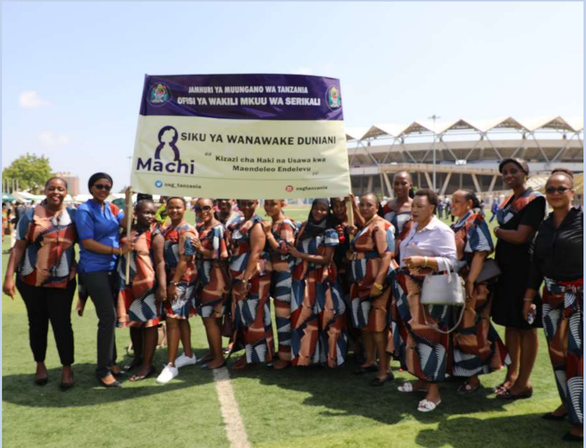
Picha ya pamoja ya baadhi ya Wanawake wa Ofisi ya Wakili Mkuu wa Serikali kwenye maadhimisho ya Siku ya Wanawake Duniani