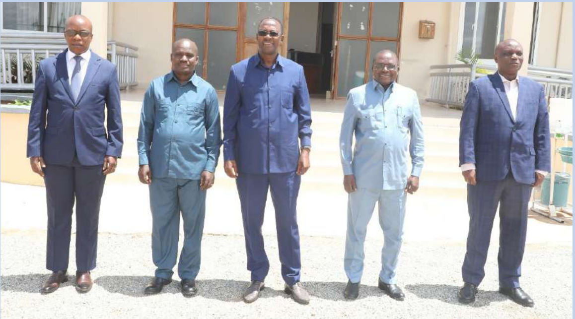
Waziri wa Katiba na Sheria Mhe. George Simbachawene (katikati) akiwa katika picha ya pamoja na Viongozi wa Ofisi ya Wakili Mkuu wa Serikali walipofika kujitambulisha ofisini kwake jijini Dodoma

Kikao hicho kimefanyika katika ukumbi wa mikutano wa Wizara ya Katiba na Sheria uliopo Mtumba Jijini Dodoma, kimewahusisha Viongozi wa Tasisi kutoka Ofisi ya Wakili Mkuu wa Serikali, Ofisi ya Mkurugenzi wa Mashtaka pamoja na Tume ya Haki za Binadamu na Utawala Bora.