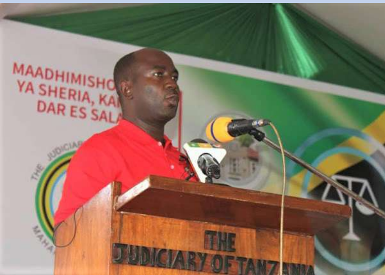
Mhe. Ngw'ilabuzu Ludigija Mkuu wa Wilaya ya Ilala